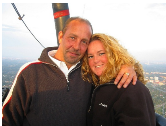
Grevinna & Greve af Stadshuset

Vi hälsar alla gäster och tillika vänner hjärtligt välkomna till vårt bröllop och tillhörande fest. Detta dygn kommer att bli vårt bästa och med din hjälp är vi övertygade att det kommer att infrias. Du får när som helst överraska oss med något skoj eller ploj då vi älskar sådant.